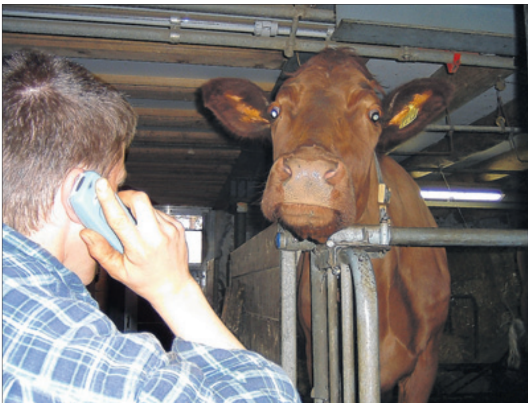
Seine Sorgen jemandem mitteilen: Bauern und Bäuerinnen können auf verschiedene Dienstleistungen zurückgreifen.

Das Sorgentelefon hat nur eine Richtung, vom Anrufer zur Nummer 041 820 02 15. Es ist quasi eine Einbahnstrasse, die man aber auch mehrmals befahren kann. Das Sorgentelefonteam nimmt keinen Kontakt zu weiteren Stellen auf und läutet auch nie zurück.