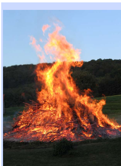
Johannisfeuer in Vierzeheiligen

Was ist der „Rote Faden“? Im Laufe der Vorbereitung muss klar werden, was das Vorbereitungsteam mit dem Gottesdienst will. Versucht mög-