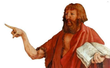
Johannes der Täufer nach Grünewald

In der Kreuzigungsszene des Isenheimer Altares wird Johannes der Täufer in ganz besonderer Weise dargestellt: Mit einem Finger, der beinahe so lang ist, wie sein ganzes Gesicht, weist Johannes die Betrachter (zur Zeit der Entstehung Kranken und diejenigen, die sich fragen, wie sie mit ihrem Leid umgehen sollen) auf die Botschaft von Tod und Auferste-